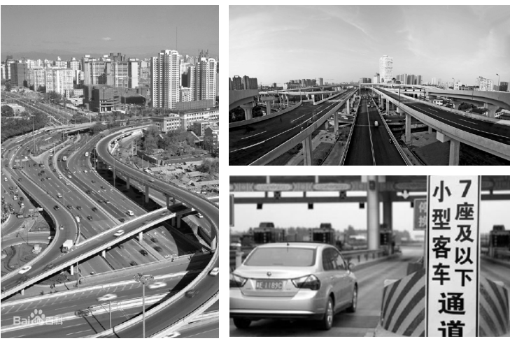
7座及以下小客车专用道